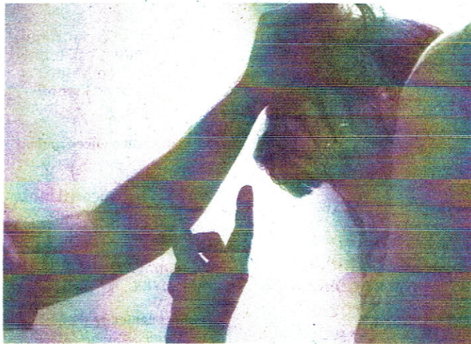
POMOC NA OBĚ STRANY. Je třeba pracovat nejen s oběťmi násilí, ale také s násilníky, shodují se odborníci.

Krizová centra poskytují služby obyvatelům nejen z okresu České Budějovice. Mezi ty, jimž pomáhají, patří i ženy, které jsou oběti násilí. Uvedené údaje ze statistik jihočeské policie jen ukazují